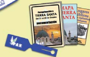
Información completa, etiquetas...