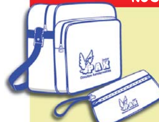
Bolsa y cartera documentación